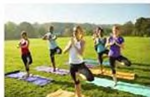
Уединение с природой