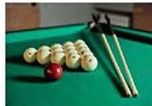
Настольные игры и другие развлечения