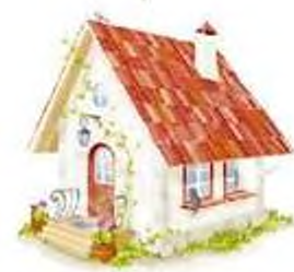
Место отдыха с семьей и коллегами