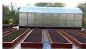
Сельский туризм (агротуризм)