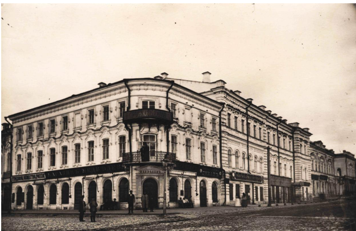
Симбирский окружной суд