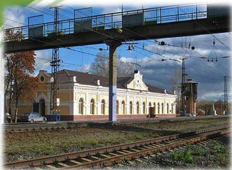
Здание железнодорожного вокзала