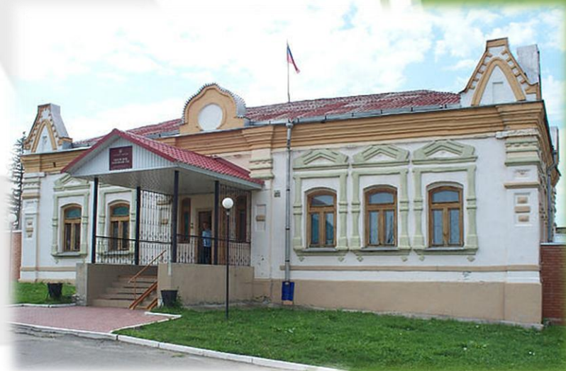
Здание районного суда