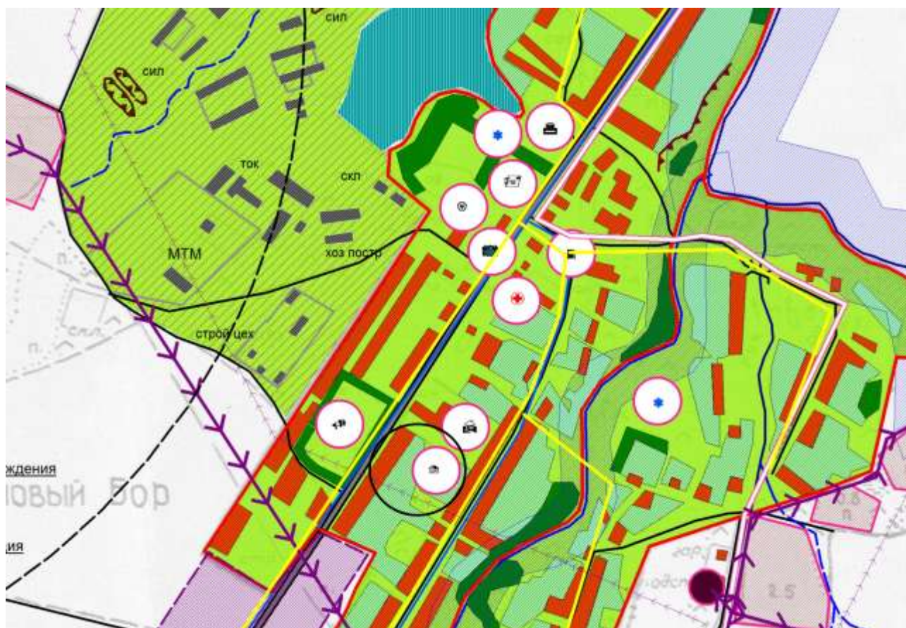
Схема границ прилегающих территорий муниципального казённого образовательного учреждения Сосновоборская средняя общеобразовательная школа