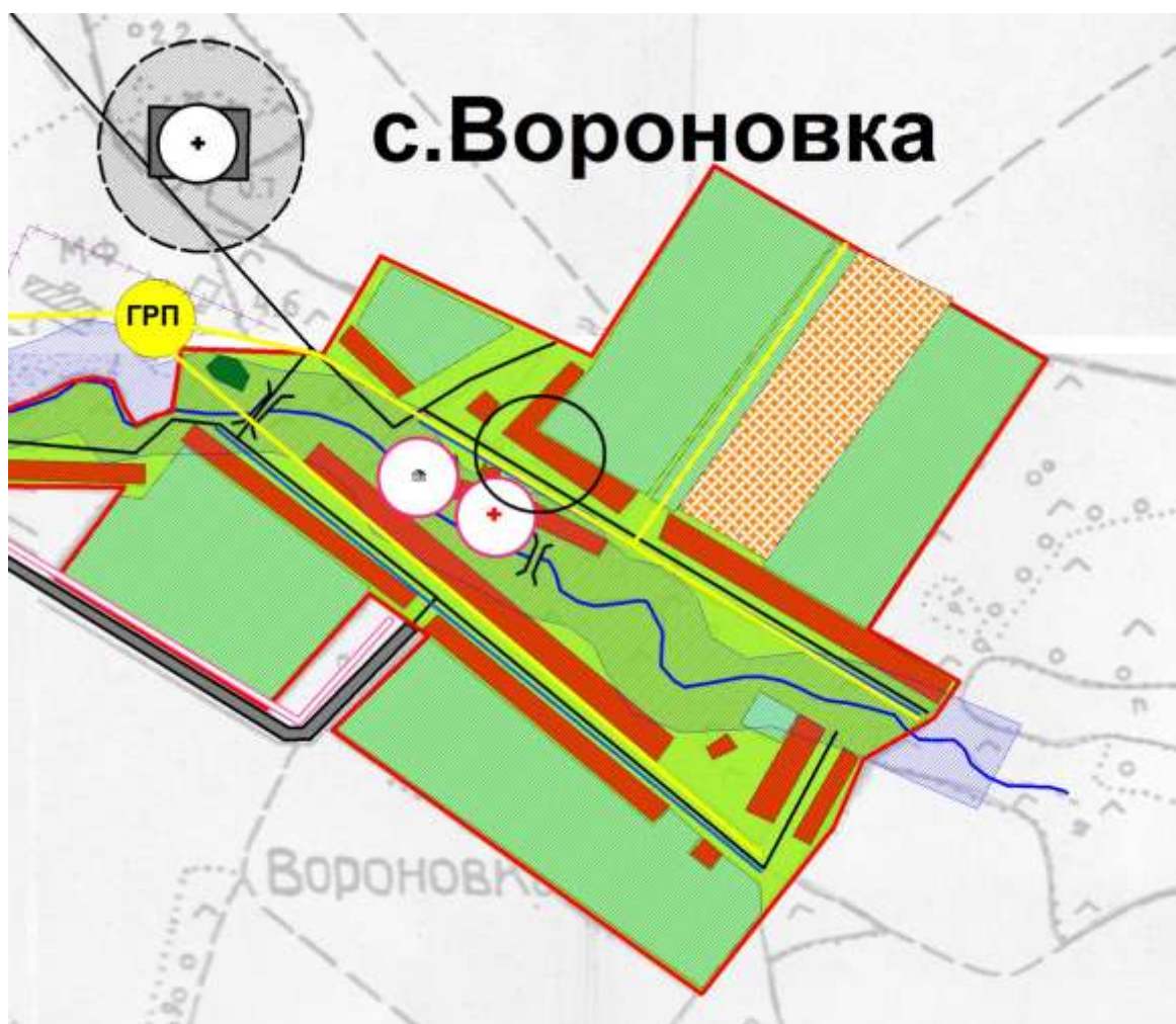
Схема границ прилегающих территорий медицинского учреждения ФАП с. Вороновка